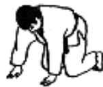
Forma de volcar (1), Uke en cuadrupedia

Las tres primeras repeticiones de cada serie deben efectuarse con una progresión en la rapidez de los ejercicios del 65% al 85%. En las tres restantes, del 85% al 100%. Se realizan hasta 4 series con un volumen de 6 repeticiones en cada serie, que consta de 5 ejercicios.