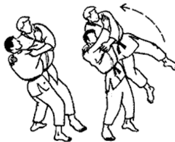
Uchi-komi (2) levantando con te-guruma , ushiro-goshi ...