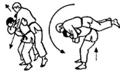
Nage-komi (1) del tokui-waza