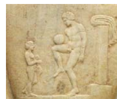
Fig. 3. Este relieve en mármol del Museo Nacional de Arqueología de Atenas muestra a un atleta griego haciendo equilibrio con un balón ( foliis ) en su muslo, presuntamente demostrándole una técnica de entrenamiento al muchacho.

Mucho más divertido era el episkyros griego, un juego parecido al fútbol, del cual no se tienen muchas referencias. El campo de juego estaba dividido en dos mitades por una línea de guijarros y limitado por dos líneas de portería, paralelas a la central; su longitud era el doble del alcance de un tiro normal de pelota. Había doce jugadores por equipo, cuya misión era pasar la pelota al otro lado de la línea contraria tantas veces como fuera posible. Quizás lo más importante del episkyros sea su noción de equipo: todos los jugadores unidos para lograr el objetivo. La labor individual era muy criticada, lo que hacía que estos jugadores griegos tuvieran siempre muy presente el sentimiento de... "¡vamos a cooperar, muchachos!". Fueron los griegos los que idearon un balón ( foliis ) eficaz relleno de aire elaborado con vejigas de mamíferos, que usaron para jugar con la mano, y se considera el origen el balonmano y el rugby. Muchas crónicas citan la afición de los griegos por el juego de pelota. Homero en su Odisea y Sófocles en las Traquinianas son algunos ejemplos.