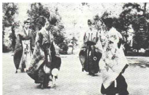
Fig. 1. Jugadores de kemari (s. XX). En el siglo X, las clases distinguidas japonesas lo adoptaron y perfeccionaron de un juego de pelota chino.

El Ts'uh Kúh pasaría al Japón, donde surgiría en la época medieval un juego cortesano. Los japoneses no adoptaron los juegos de pelota competitivos chinos, pero en el siglo X d. C. (y posiblemente antes) las clases distinguidas tomaron y perfeccionaron este juego de pelota chino, que llamaron Kemari , el cual se menciona por primera vez hace unos 1400 años. El Kemari era más un juego de habilidad que el propio y brutal juego del Ts'uh Kúh en la China Antigua. Se jugaba en un terreno cuadrado con sus cuatro esquinas marcadas por un árbol diferente (sauce al sureste, cerezo al noreste, pino al noroeste y arce al suroeste) cortado a 4 metros del suelo. Es un tipo de fútbol en círculo, mucho menos espectacular, pero mucho más digno y solemne. En una superficie relativamente pequeña, los jugadores se pasan la pelota, sin dejarla caer al suelo. El jugador tenía que usar los pies, las rodillas e incluso la cabeza para poder controlar, dominar y conducir la pelota. Es un ejercicio ceremonial, que exige cierta habilidad, pero que no tiene ningún carácter competitivo, como el juego chino, y no representa ninguna lucha por la pelota. Todavía hoy en día se practica, aunque como ejercicio esotérico por parte de los sacerdotes en los claustros de algunos templos.