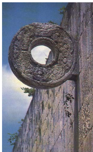
Fig. 2. Círculo de piedra de uno de los muros verticales del juego de pelota de Chichén Itzá (período maya-tolteca, s. X-XIII), México.

Datos similares hablan de que otras culturas de indios de Centroamérica, como los Mayas , y de Suramérica, como los Chibchas , los Aymara y hasta los Araucanos , jugaron algo parecido al fútbol, aficiones que fueron descritas muchas veces como "juegos brutales". Fray Bartolomé de las Casas, quien fuera defensor de la causa de la esclavitud de los indígenas en la colonización española, fue uno de los que consideró salvajes estos juegos. Por otra parte, grupos indígenas de Norteamérica llegaron a practicar similares juegos de pelota con el fin de agradecer a los dioses sus buenas cosechas. Este juego llegaría con el tiempo a ser uno de sus principales pasatiempos, como el lacrosse , practicado en Canadá y extendido a varios países del mundo.