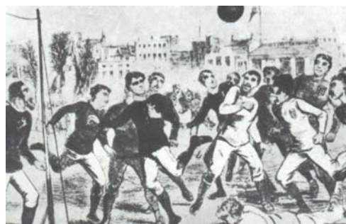
Fig. 6. En un principio, las características del fútbol y del rugby estaban poco diferenciadas. Se permitían coger el balón con la mano en determinadas condiciones y también atacar al adversario agarrándolo en incluso darle patadas.

En 1846, se fijaron en Rugby las primeras reglas de fútbol con carácter obligatorio. Sin embargo, el juego se mantuvo rudo: por ejemplo, estaba permitido patear la pierna de adversario debajo de la rodilla, pero no estaba permitido sujetar al adversario y patearlo al mismo tiempo. También estaba permitido jugar con la mano y, desde que en 1823, para sorpresa de su equipo y de los adversarios, William Webb Ellis corrió con el balón debajo del brazo, se permitió llevar también el balón con la mano. Muchos otros colegios adoptaron las reglas elaboradas en Rugby, otros se opusieron a este tipo de fútbol, por ejemplo, Eton , Harrow y Winchester , donde no se permitía llevar el balón con la mano y donde figuraba en primer lugar el dominio de la pelota con el pie. También Charterhouse y Westminster apoyaron el juego sin las manos, pero no se aislaron como algunos colegios, sino que fueron los puntos de partida para la difusión de su propia versión del juego. En la Universidad de Cambridge , donde en 1848, en el